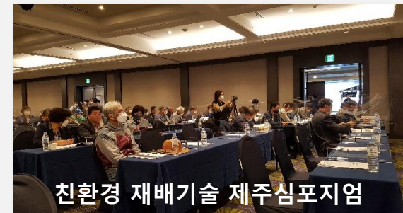
친환경 재배기술 제주심포지엄