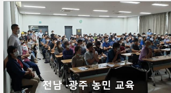
전남 광주 농민 교육